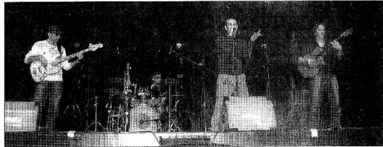
Zand'Zar sur scène, c'est l'atmosphère de la Comedia dell'arte mise en valeur par la musique et la chanson.

Une manière de me rapprocher de mes origines. Une manière aussi de dire que nous vivons dans un pays très éclectique, très ouvert culturellement. Zand'Zar, c'est en fait un groupe français qui chante en langue étrangère et plus précisément en italien. Trop souvent l'italien a un côté cliché romantique. Vous entendrez rarement du jazz chanté en italien... Or, avec Zand'Zar, un peu dans la même veine que Paolo Conte, nous voulons chanter en italien tout en laissant une grande place à la musique. Cela est certainement